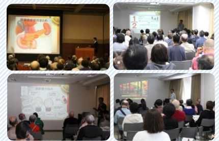
医療講演 開催風景